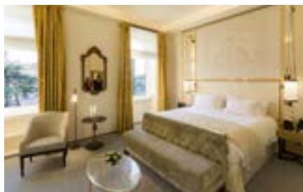
L'une des 98 chambres, conçue comme un écrin doré.