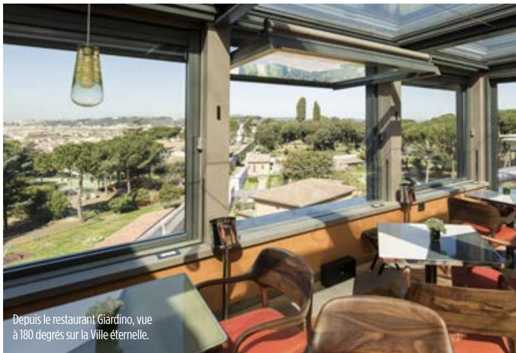
Depuis le restaurant Giardino, vue à 180 degrés sur la Ville éternelle.

Les associés n'en sont pas à leur coup d'essai dans l'univers du luxe. C'est eux qui, depuis quinze ans, réinventent les boutiques Cartier dans le monde. Eux également qui ont été choisis par François Pinault pour la transformation de Château Latour, à Pauillac, dans le Médoc. Eux encore qui viennent de signer le